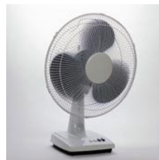
Ventilateurs 2 h/jour = 1,2 €/an

L'été, faites les bons gestes pour être au frais, chez vous, sans climatisation. Se passer de climatisation, c'est éviter l'émission de gaz à effet de serre et une forte augmentation de sa facture d'électricité.