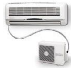
Climatiseurs 2 h/jour = 77 €/an